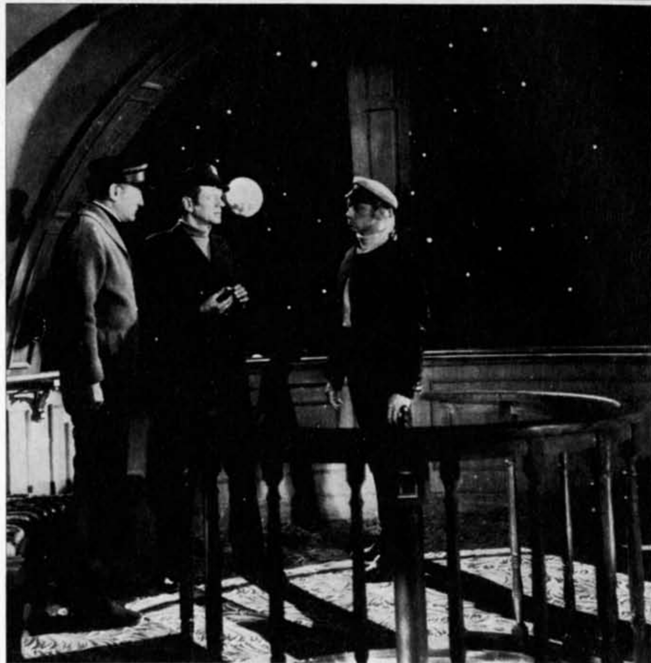
DE LA TERRE A LA LUNE (1958).